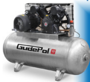
kompresor tłokowy HD